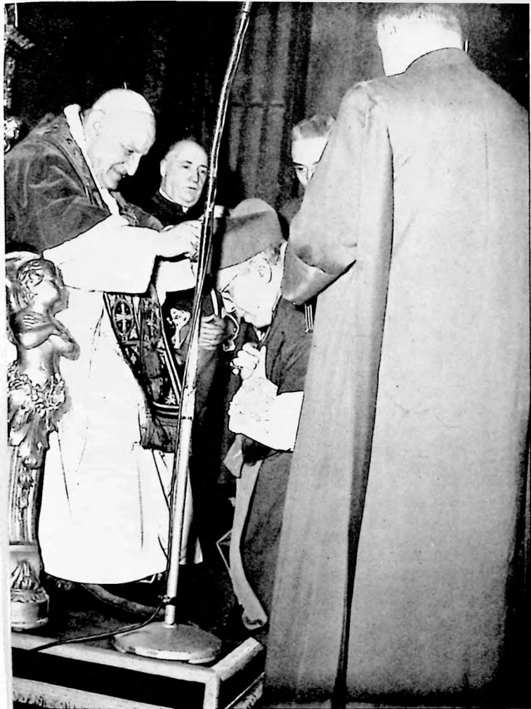
L'IMPOSITION DE LA BARRETTE.