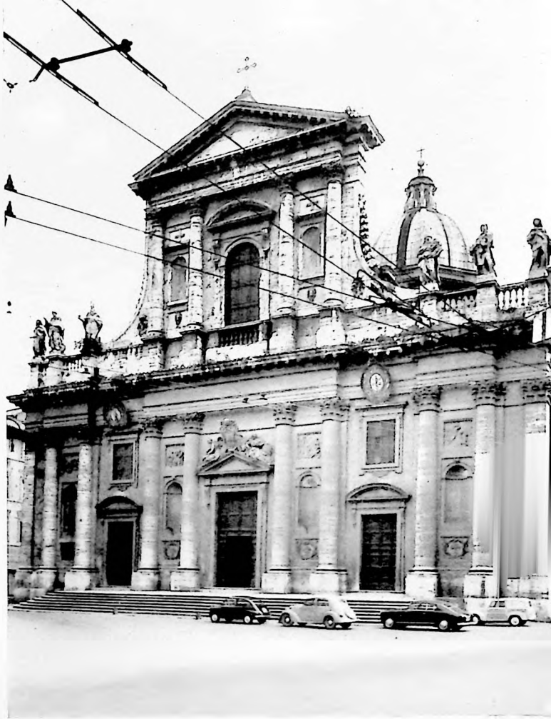
L'ÉGLISE SAINT-JEAN-BAPTISTE DES FLORENTINS.