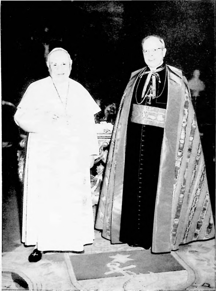
L'AUDIENCE PAPALE : S. S. JEAN XXIII ET SON ÉM. LE CARDINAL LEFEBVRE.