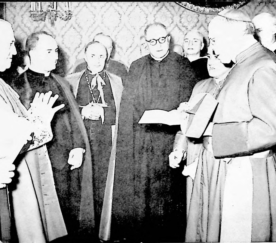
LA REMISE DU BIGLIETTO.