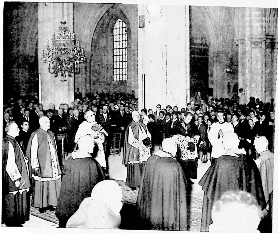
L'ALLOCATION DE MGR LE DOYEN DU CHAPITRE A LA CATHÉDRALE DE BOURGES.